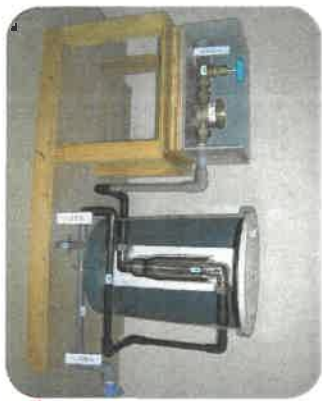
エミール設置状況 水量器二次側に設置